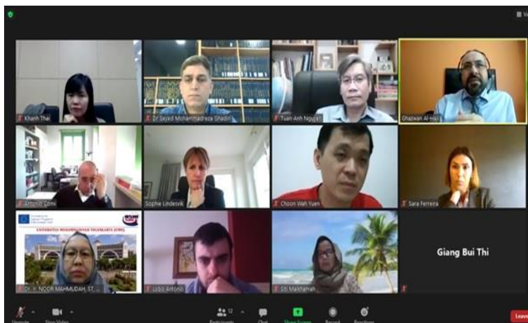
Họp Khởi động dự án ASIAsafe vào ngày 22-23/02/2021